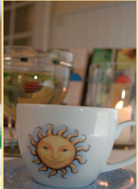
FRISCHE KRÄUTER IN FORM VON BRÜHEN ODER TEES SIND KULINARISCHE FASTEN-GENÜSSE. IM FASTENZIMMER STEHT IM SAMOVAR IMMER HEISSES WASSER UND EINE GROSSE AUSWAHL AN KRÄUTERN BEREIT.

EIN EINBLICK IN DIE FASTENTAGE. Fastentage bedeuten eine Auszeit für den Körper, die bewusst erlebt wird. Die Tage beginnen mit frisch gepressten Obstsaften und stärkenden Kräutertees. Mittags reicht die Küche eine Gemüsebrühe mit frischen Kräutern. Zur Mittagsruhe bringt eine Mitarbeiterin ein warmes Heublumensäckchen aufs Zimmer. Die Heublumen fördern die Funktion der Leber, die während des Fastens die größte Stoffwechselleistung erbringt. Nach der Mittagsruhe genießt man vitalisierenden Kräutertee mit Honig. Im Fastenzimmer steht im Samovar jederzeit heißes Wasser und eine große Auswahl an Kräutern für die Gäste bereit. Am Abend stärkt ein frisch gepresster Gemüsesaft den Körper – besonders wohltuend am wärmenden Kachelofen. Das Fasten wird durch viel Ruhe und Entspannung sowie Bewegung und frische Luft unter-