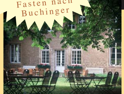
... Platz zum Sein ...

Wer zu Menschels Vitalresort mit seiner wunderbaren Therme im Park reist, stärkt Körper und Geist, wird heiter und gelassen und schöpft vom ersten Tag an das volle Erholungspotenzial aus. Nicht zu vergessen sind natürlich auch die absolut leckeren und gesunden Verlockungen der 100% biologisch-kulinarischen Cuisine Wellness BIO.