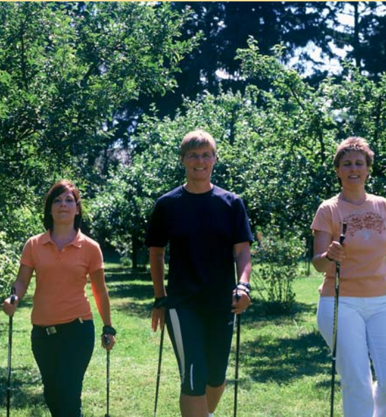
FASTENZEIT BEDEUTET: FRISCHE SÄFTE, VIEL BEWEGUNG. EINFACH PURE LEBENSFREUDE.