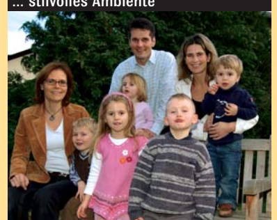
... und ein junges Team