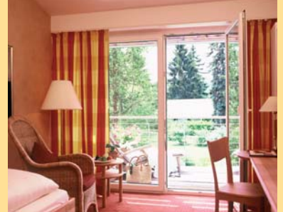
... stilvolles Ambiente